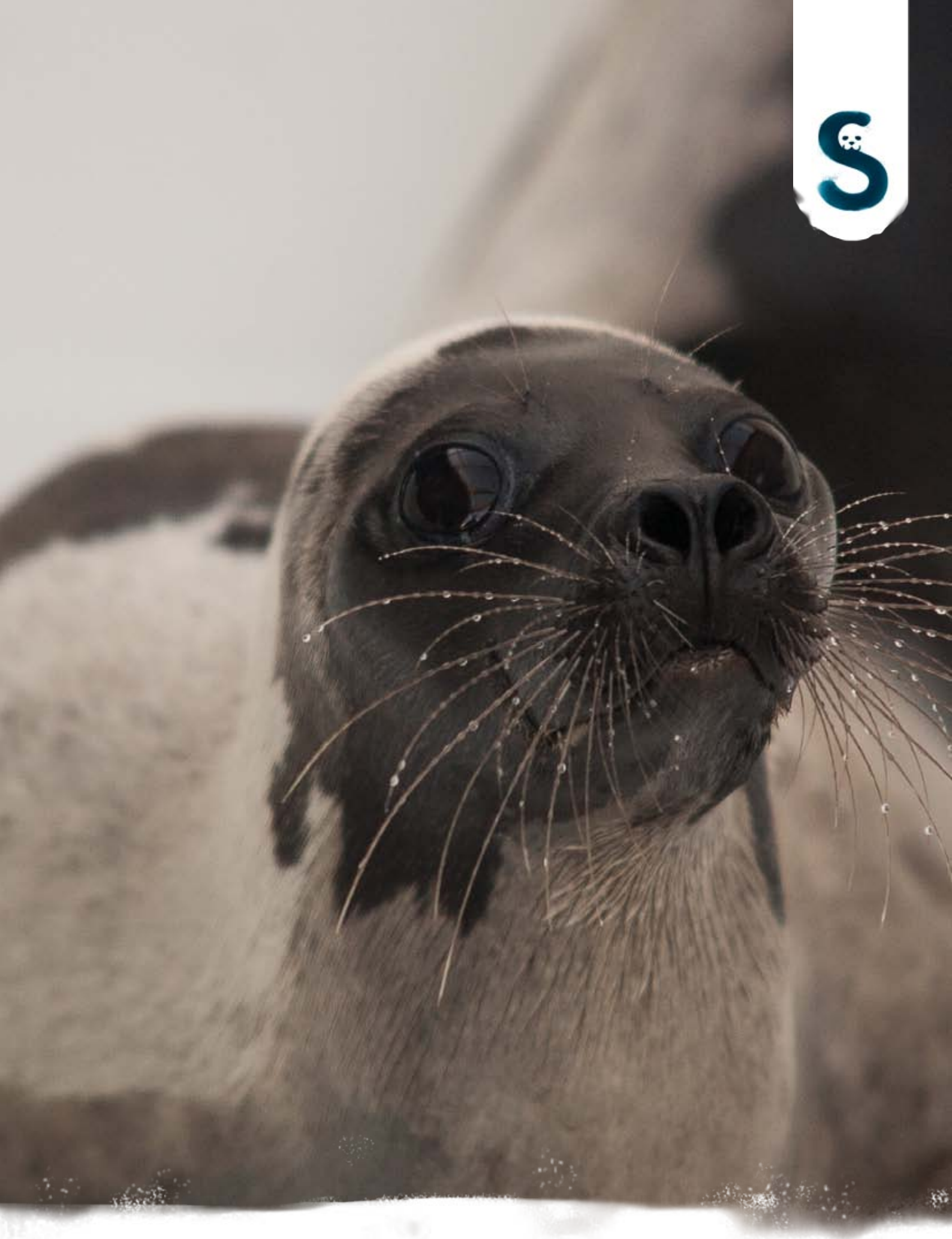
ZADELROB SUMMER IN ZEEHONDENCENTRUM PIETERBUREN (2016)