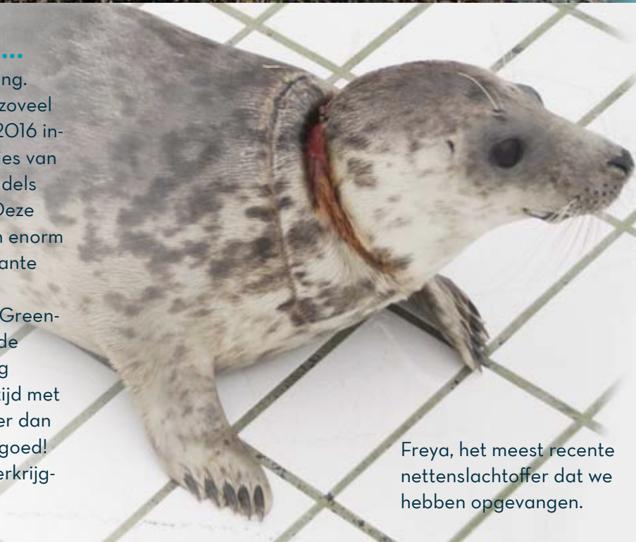
Freya, het meest recente nettenslachtoffer dat we hebben opgevangen.

De laatste aanvulling op ons assortiment komt van Green-toys. Zij maken duurzaam speelgoed van gerecyclede plastic melkflessen. Hun speelgoed wordt zorgvuldig ontwikkeld met veel aandacht voor veiligheid en altijd met duurzame grondstoffen. Inmiddels hebben zij al meer dan 46 miljoen plastic flessen kunnen omzetten in speelgoed! Deze producten zijn in onze winkel in Pieterburen verkrijgbaar en steeds meer via onze website.